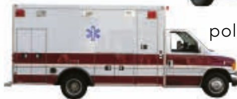
greitosios pagalbos automobilis