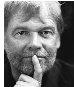
Justeinas Gorderis.

Norvegų rašytojo Justeino Gorderio ( Jostein Gaarder , g. 1952 m.) kūryba žinoma toli už jo tėvynės ribų. Romanas „Sofijos pasaulis“, išverstas į daugiau nei penkiasdešimt kalbų, jau yra pasiekęs kone visus pasaulio kampelius. Prieš keletą metų svečiuodamasis tarptautinėje Vilniaus knygų mugėje Gorderis sakė, kad nesitikėjo