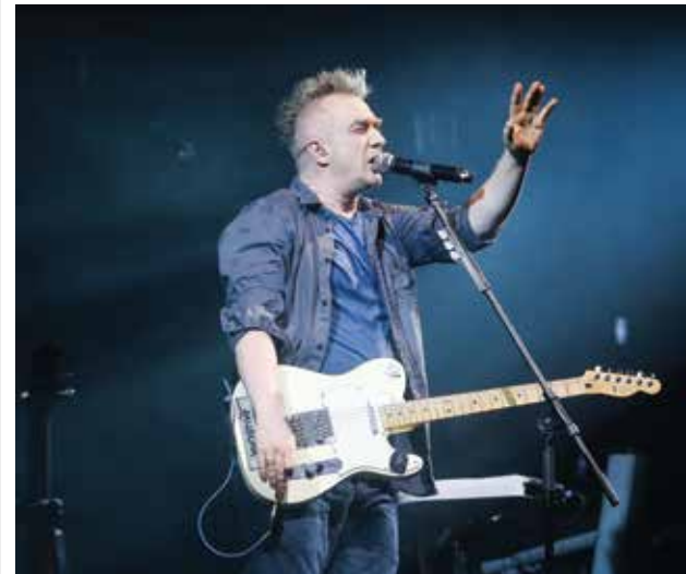
Andrius Mamontovas.

Daug kas galėtų žiūrėti skeptiškai, bet aš manau, kad jei žmogus nori gyventi gerai, jis turi skaityti knygas. Knygos lavina fantaziją, ugdo loginį mąstymą, pastabumą, gebėjimą susikaupti ir t. t. Visos