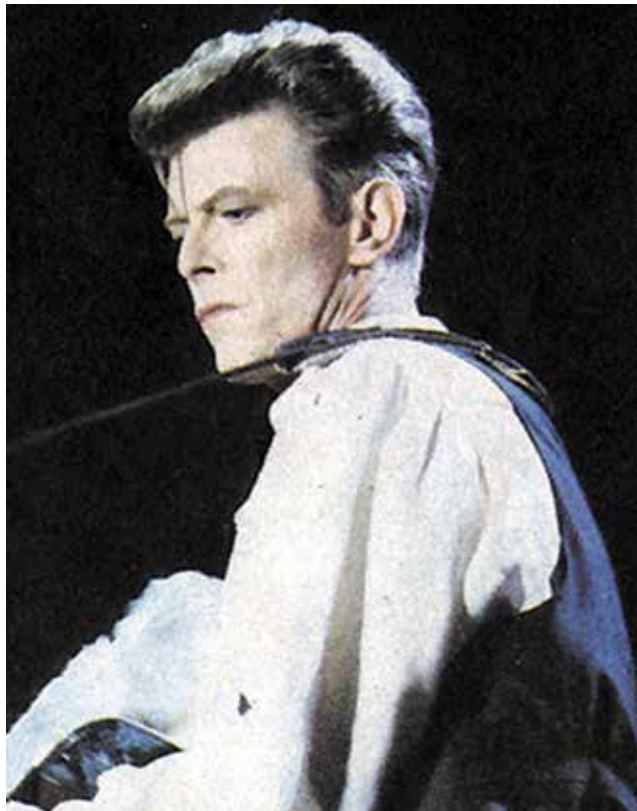
Deividas Bouvis roko festivalyje Čilėje 1990 metais.

Ar verta skaityti knygas? Jums tikriausiai žinomas anglų dainininkas, rašytojas ir aktorius Deividas Bouvis ( David Bowie ), išbandęs įvairius muzikos stilius ir turintis milijonus gerbėjų, aistringas knygų skaitytojas ir kolekcininkas, sako: „Jei aš vėl būčiau jaunas, gyvenimo prasmės ieškočiau skaitydamas.“ Šaunusis kareivis Šveikas, čekų rašytojo Jaroslavo Hašeko ( Jaroslav Hašek ) labai juokingo romano herojus, tikriausiai nesutiktų. Jo manymu, knygos – tai tik šūsnyš supjaustytų ir surištų lapų, todėl skaityti neverta. Jeigu taip, kažin ar knygos visais laikais būtų buvę skiriama tiek dėmesio. Knygas, perrašinėjamas ir saugomas vienuolynuose, galėjo skaityti tik išrinktieji. Kai kurios buvo draudžiamos ir deginamos, už jų skaitymą ir platinimą grėsė kalėjimas ar tremtis. Mūsų laikais sudarinėjami įdomiausių, nepamirštamų, didžiausią įtaką padariusių knygų dešimtukai ir šimtukai, pasaulio įžomybės skelbia mėgstamų knygų sąrašus.